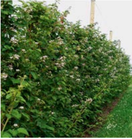
'Chester Thornless' zur Blüte, 3. Standjahr