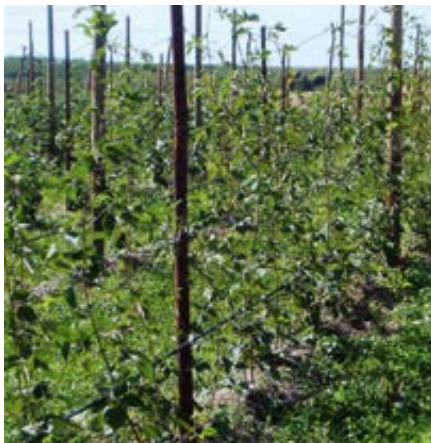
'Loch Ness' im Pflanzjahr (Herbst)