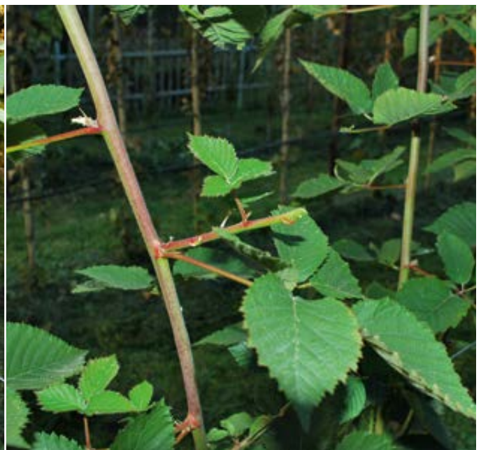
'Navaho' nach dem Sommerschnitt