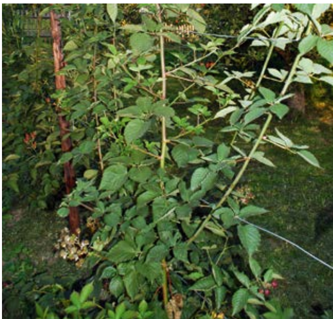
'Navaho' vor dem Sommerschnitt

Bei länger anhaltender Trockenheit im Sommer ist es notwendig, die Brombeeren zu bewässern. Die Bewässerung wirkt sich vorteilhaft auf die Größe der Früchte aus. Die Stickstoffdüngung erfolgt im zeitigen Frühjahr. Der Stickstoffbedarf beträgt etwa 8 g N pro m 2 und Jahr. Die zu düngende Stickstoffmenge errechnet sich aus Stickstoffbedarf minus im Boden vorhandener Stickstoff (N min ). Bei Böden mit einer mittleren Nährstoffversorgung erfolgt im Frühjahr eine Düngung mit 4 g/m 2 Stickstoff.