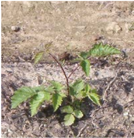
'Loch Ness' im Pflanzjahr (Frühjahr)