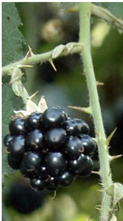
'Theodor Reimers' mit Stacheln