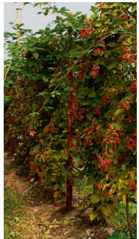
'Chester Thornless' zur Ernte, 3. Standjahr