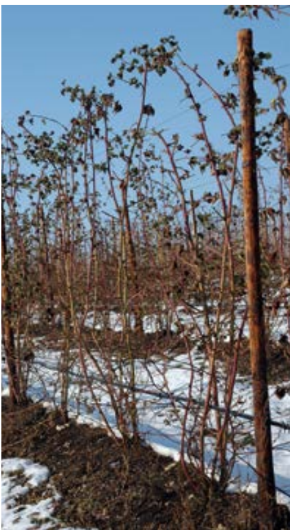
'Chester Thornless' fächerförmige Erziehung vor dem Winterschnitt