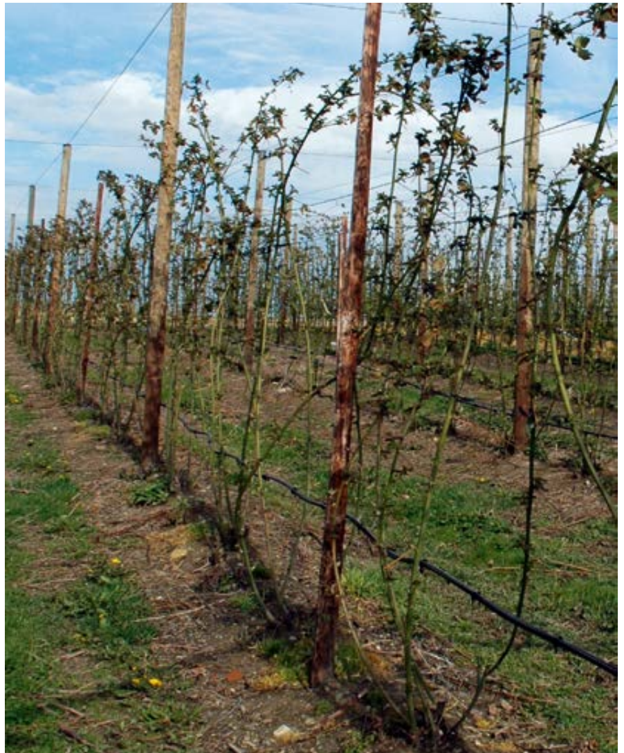
'Chester Thornless' fächerförmige Erziehung nach dem Winterschnitt