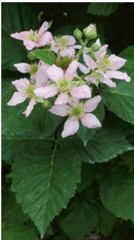
'Chester Thornless' mit attraktiven Blüten

Brombeersorten für den Garten sollten möglichst gering anfällig sein gegenüber Krankheiten und Schaderregern und einen guten Geschmack aufweisen. Bei Brombeeren gibt es bestachelte und stachellose, aufrechtwachsende und rankende Sorten. Stachellose Sorten wie z. B. 'Loch Ness' sind leichter zu pflegen und zu beernten. Die stark bestachelte und sehr stark wachsenden Sorte 'Theodor Reimers' ist aufgrund des guten Geschmacks ihrer Früchte immer noch im Anbau zu finden. Bei dieser Sorte ist jedoch eine konsequente Erziehung und ein strenger Schnitt erforderlich, sonst ist die Ernte sehr beschwerlich.