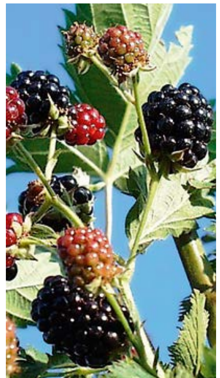
'Loch Ness' stachellos